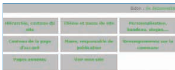
Gestion du site : par souci de simplicité, l'accès aux différentes fonctionnalités est regroupé dans un « tableau de bord ».

Aucun risque qu'un prestataire indélicat ne s'approprie les contenus de